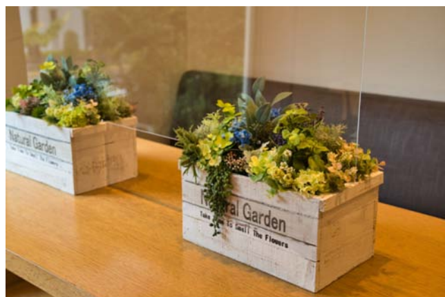
TSUNAGU カスタマイズイメージ